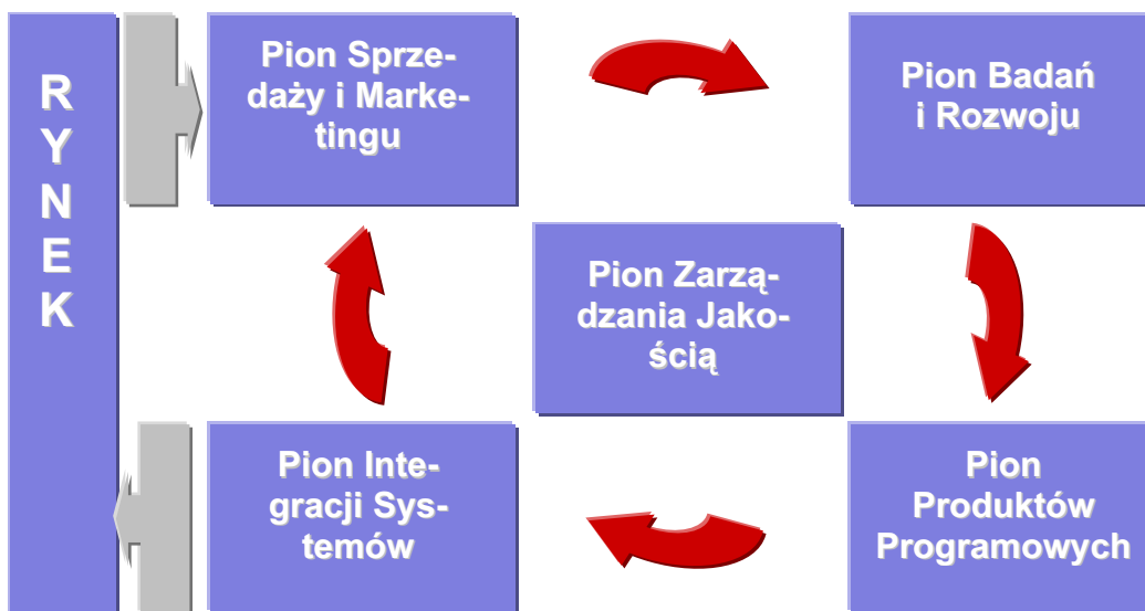
Rys. 1. Przepływy informacyjne w Rodan.

Nad całym cyklem czuwa PZJ, który jest odpowiedzialny za niezależną certyfikację produktów (tzn. potwierdzenie lub zanegowanie, że produkt opuszczający PPP posiada wymagane cechy) oraz utrzymanie i poprawę przepływów między pionami (procesy).